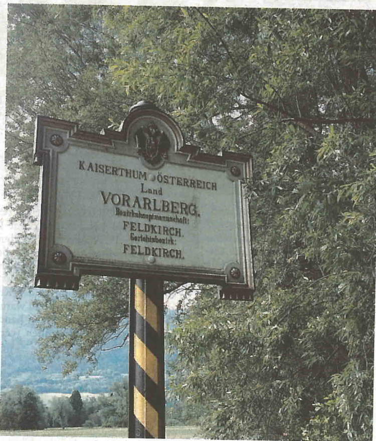
Grenztafel Ruggel Bangs

Oft wissen Bürger einer Gemeinde mehr über fremde Länder als über ihre eigene Region. Wenn wir in ein Land reisen, informieren wir uns meist davor schon über Sitten und Gebräuche. Erfahren mystische Vergangenheiten und erforschen wissbegierig fremde Pfade und erfreuen uns an der fremden Kultur. Dass auch wir in einer sagenumwobenen Land leben ist uns meist nicht bewusst. Die Kommission BeWegung-Begegnung organisiert jährlich einige Veranstaltungen um die 6 grenzüberschreitenden Gemeinden miteinander zu verbinden und wie bei dieser Veranstaltung Geschichten aus der Grenzregion dem Bewohner oder auch Interessierten Besucher von außerhalb näher zu bringen. Start und Treffpunkt des leichten Spazierganges welcher auch problemlos mit Kinderwagen zu bewältigen ist, ist um 16 Uhr beim Ruggeler Vereinshaus an der Kanalstraße. Die Route führt vorbei